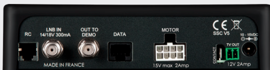
Rückansicht S.S.C.® HD-Steuermodul

Softwareupdates können auf USB-Basis leicht selbst ausgeführt werden. Im TV-Betrieb (z.B. SAT + LED TV 19") überzeugt es mit einem sehr geringen Stromverbrauch von nur 17 Watt (Standby: 0,4 Watt). Über einen zusätzlichen Netzschalter (0 Watt) lässt es sich komplett ausschalten.